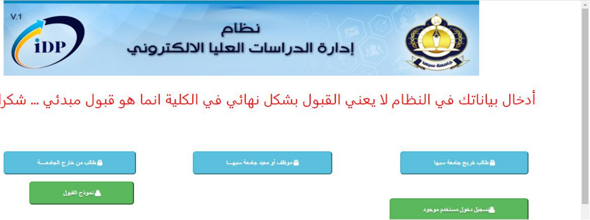
شكل 1 الواجهة الرئيسية لتسجيل الطلاب الجدد

سوف يظهر امامك خمس ايقونات كما في الشكل 1.