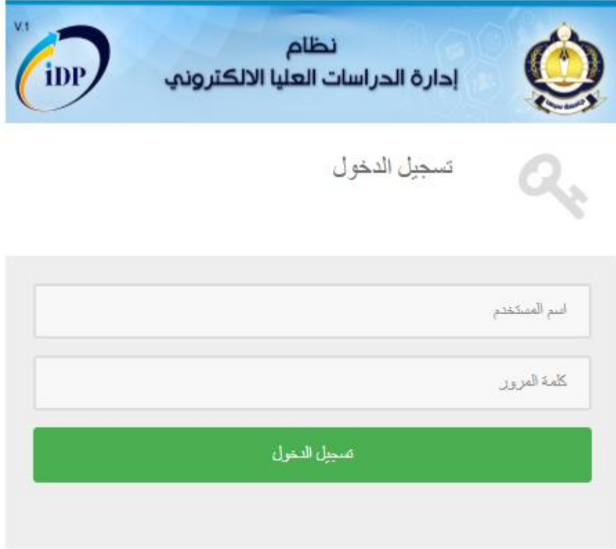
شكل 6. بوابة تسجيل الدخول

يمكنك الدخول إليها بمجرد حصولك على اسم مستخدم وكلمة مرور. وذلك لاستكمال بعض البيانات المطلوبة وكذلك لطباعة نموذج طلب الالتحاق بالدراسة. كما في الشكل 6.