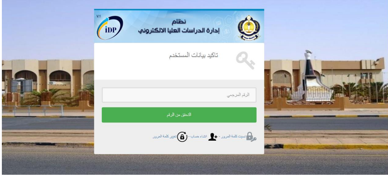
شكل 3. واجهة ادخال الرقم المرجعي

هذه الأيقونة خاصة بالمتقدمين الذين يشغلون وظيفة اما معيد أو موظف بجامعة سبها. عند الضغط عليها سوف يطلب منك إدخال الرقم المرجعي كما في الشكل 3. بعد التحقق من الرقم المرجعي سوف تظهر لك البيانات الخاصة بك. قم بالتأكد عليها واستمر في عملية التسجيل.