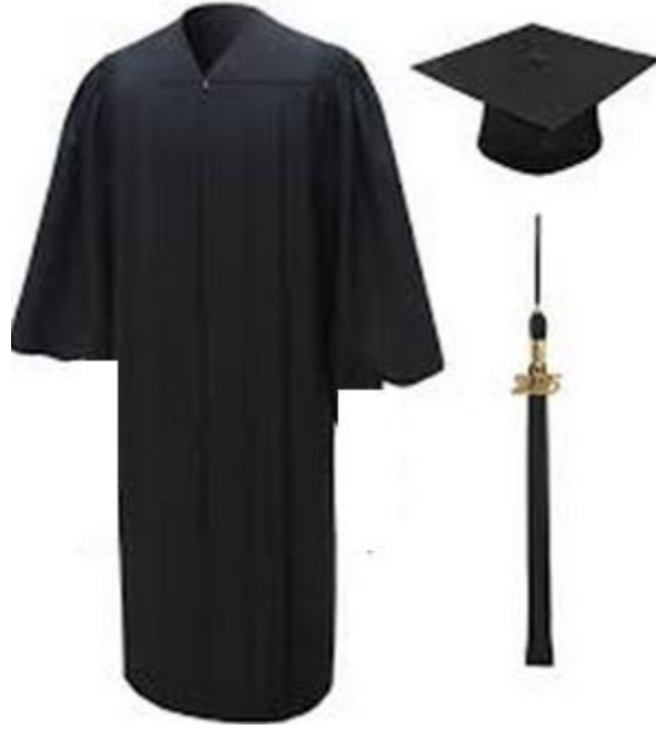
شكل 1 يوضح اساسيات للزي العام للخريجين