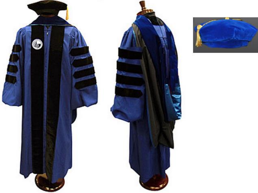
شكل 3 يوضح ملابس رئيس الجامعة الرسمي للحفل وضيوف الشرف