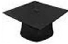
شكل 5 يوضح تصميم القبعة لحفل التخرج

تكون مصنوعة من نفس نوع القماش المصنوعة منه الثوب وباللون الاسود للخريجين وباللون الازرق للملكي لأعضاء هيئة التدريس ورئيس الجامعة للتوضيح انظر شكل 5