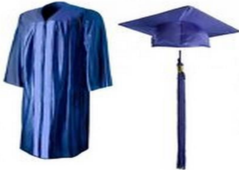
شكل 2 يوضح زي أعضاء هيئة التدريس بجميع الكليات