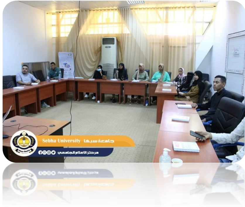
- الانظمة الالكترونية لجامعة سبها (2)