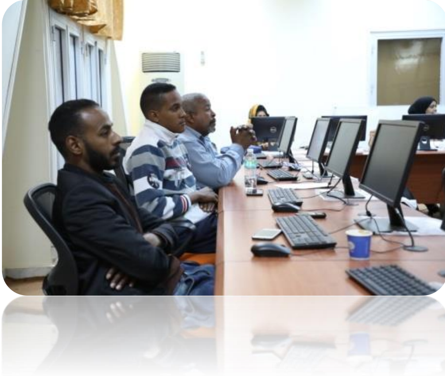
- مخرجات التعلم