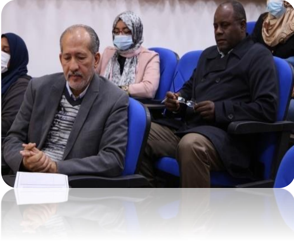
- دمج المراسلات (1)