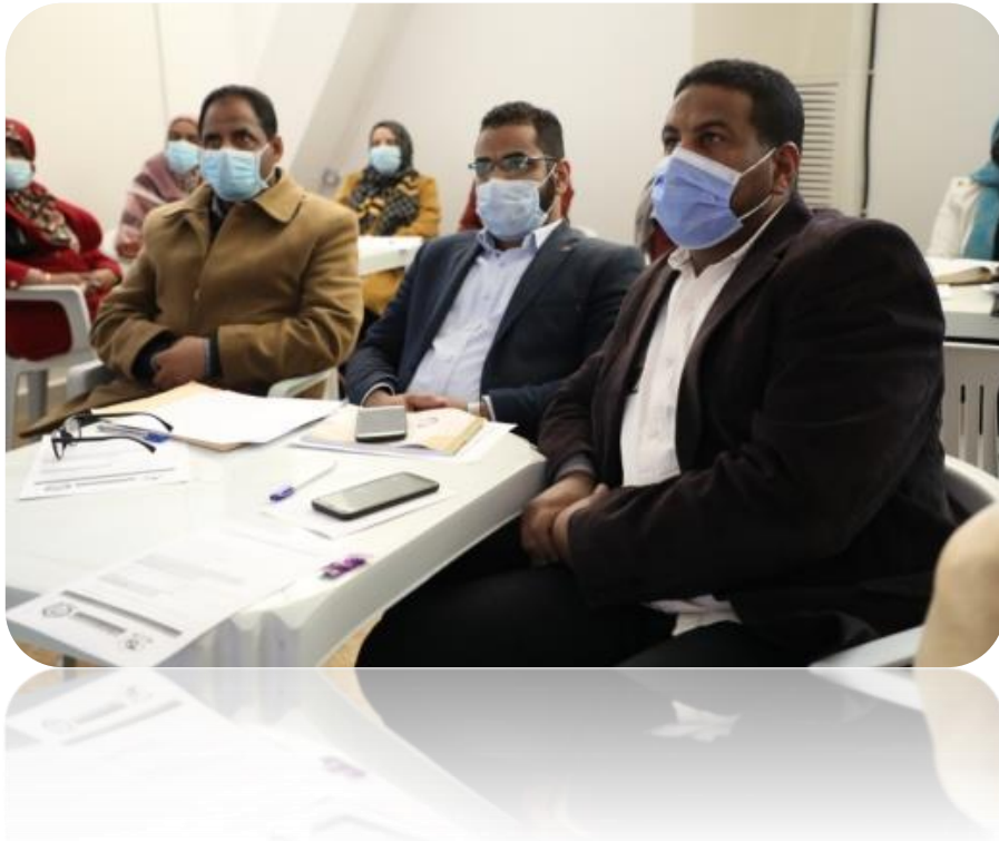
- المحاسبة الحكومية واعداد المرتبات